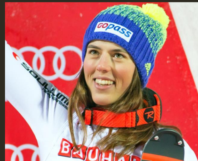
Petra Vlhová (Profesionálna lyžiarka)